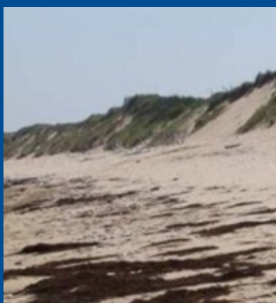
PIED DE DUNE