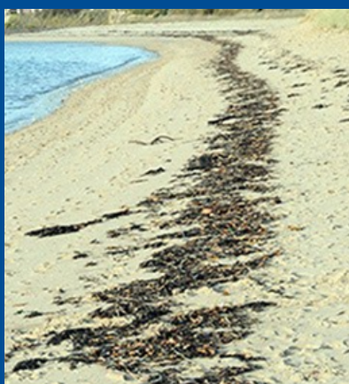
LAISSE DE MER

Ces informations vous seront rappelées lors du briefing et seront affichées sur le site de course.