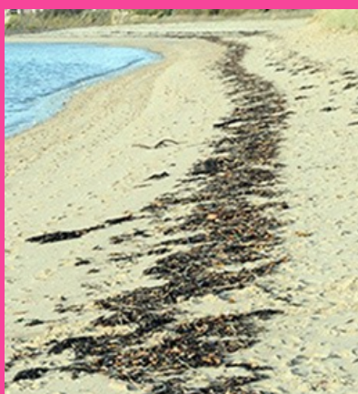
LAISSE DE MER

Ces informations vous seront rappelées lors du briefing et seront affichées sur le site de course.