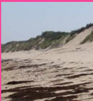
PIED DE DUNE