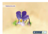
Violette de Curtis

En dépit de son apparence, le Panicaut est une plante protégée qui est aussi l'emblème du Conservatoire du Littoral. Il ne s'agit pas d'un chardon mais d'une plante de la famille des carottes. Le Panicaut maritime est une plante protégée.